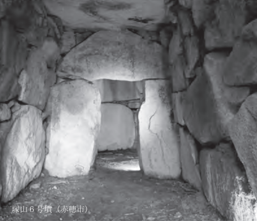
塚山 6 号墳 (赤穂市)