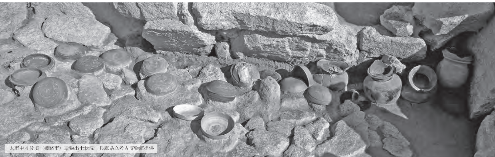
太市中 4 号墳 (姫路市) 遺物出土状況

今回の展示では、個性豊かな播磨地域の「群集墳」から、当時の社会・死生観とその変化を考えます。