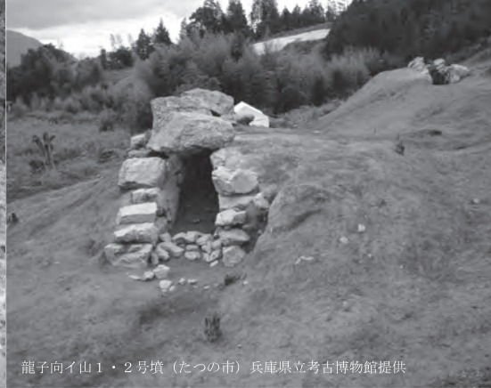
龍子向イ山 1・2 号墳 (たつの市)