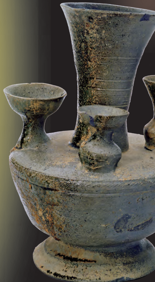
西脇79号墳（姫路市） 出土装飾須恵器（兵庫県立考古博物館蔵）