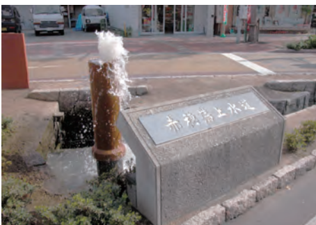
旧赤穂上水道モニュメント