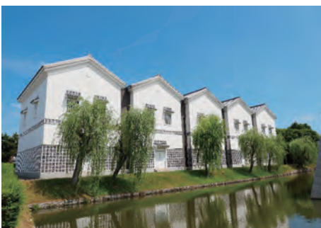
赤穂市立歴史博物館