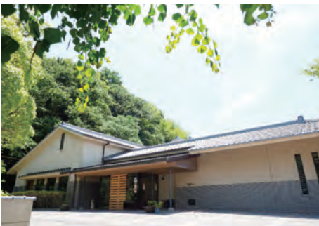
赤穂市立美術工芸館田淵記念館

田淵記念館は、江戸時代前期より塩田・塩問屋などを営んできた田淵家から赤穂市へ寄贈された美術品・古文書類を展示・保存する施設として平成9(1997)年に開館した。収蔵・展示されている美術品は日本画・書・茶道具・婚礼道具など多岐にわたり、なかでも茶道具はその数も多く、貴重なコレクションである。また大石内蔵助良雄の画と伝えられる絵が4幅ある。