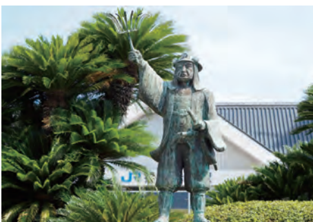
大石内蔵助良雄像（JR 播州赤穂駅前）

禄 14（1701）年 3 月 14 日夕刻に赤穂藩士早水藤左衛門・萱野三平が早かごで江戸を出発し、赤穂城下に着いたのは 3 月 19 日の早朝であった。彼らは、155 里（約 620 km）の行程を 4 昼夜半早かごに揺られ続け事件の第一報を知らせた。城下に着いた両人は、この井戸の水を飲んで一息ついてから、家老である大石良雄邸の門を叩いたと言われ、以来この井戸を「息継ぎ井戸」と呼ぶようになった。