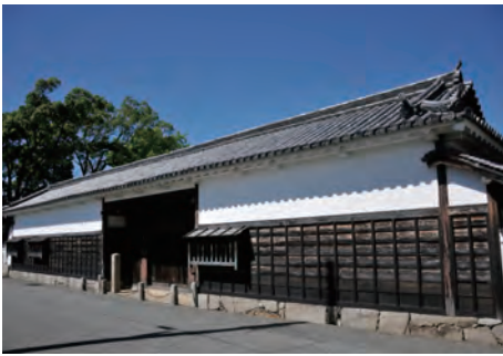
大石良雄宅跡長屋門

赤穂城の清水門の外にあり、往時には米蔵があった。外観は米蔵にちなんだ白壁の土蔵風の建物で、「塩と義士の館」として平成元 (1989) 年に建設された。常設展示は、国指定重要有形民俗文化財の「赤穂の製塩用具」を中心に「赤穂の塩」、模型・絵図・出土遺物からみた「赤穂の城と城下町」、史実と文化の両面からとらえた「赤