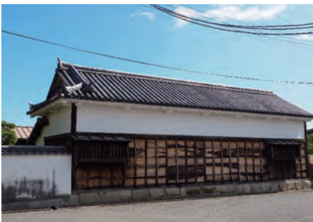
近藤源八宅跡長屋門