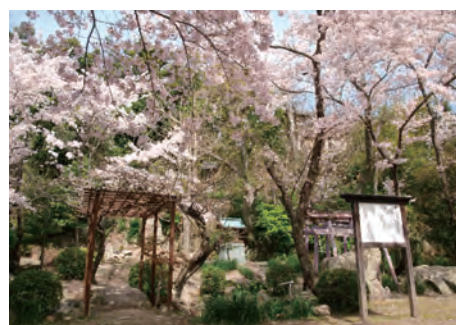
伝大石良雄仮寓地跡（おせど）