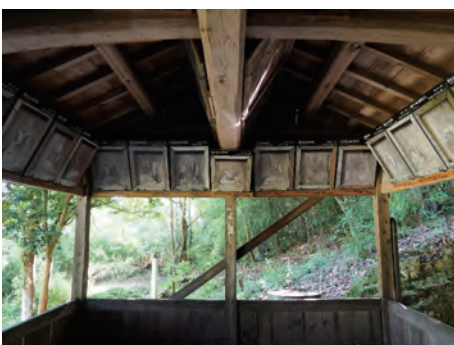
黒尾 須賀神社 義士画像図絵馬

絵馬は 49 面の人物絵馬と 1 面の奉納額で構成され、絵師は京狩野派 すがわらいとく の菅原永得である。各絵馬には享年や辞世の句も記されているため、四十七士のうち 46 人が判別可能で、吉田忠左衛門の絵馬が欠落していることがわかっている。義士に加えて矢頭長助・菅野三平・橋本久蔵の 3 人が「義士一列」として加えられている。旧赤穂郡内に所在する 24 の義士画像図絵馬のうち最古のものである。