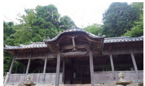
木生谷 三宝荒神社