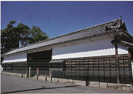
大石良雄宅跡長屋門