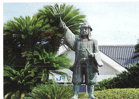
大石内蔵助良雄像 (JR 播州赤穂駅前)

禄 14 (1701) 年 3 月 14 日夕刻に赤穂藩士早水藤左衛門・萱野三平が早かごで江戸を出発し、赤穂城下に着いたのは 3 月 19 日の早朝であった。彼らは、155 里 (約 620 km) の行程を 4 昼夜半早かごに揺られ続け事件の第一報を知らせた。城下に着いた二人は、この井戸の水を飲んで一息ついてから、家老である大石良雄邸の門を叩いたと言われ、以来この井戸を「息継ぎ井戸」と呼ぶようになった。