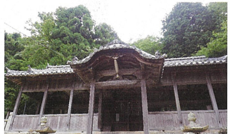
木生谷 三宝荒神社