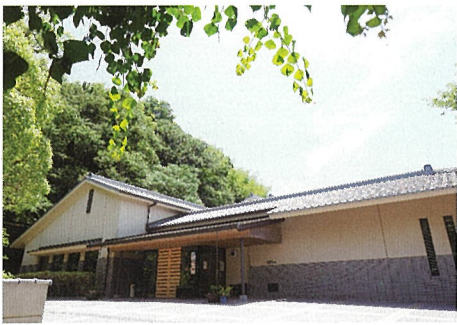
赤穂市立美術工芸館田淵記念館