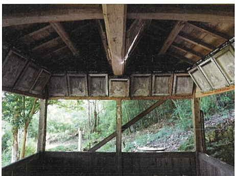
黒尾 須賀神社 義士画像図絵馬

連署起請文 きしょうもん がある。討ち入りを決意した大石内蔵助は同志を選ぶため、提出させた起請文を返し戻すことで、その反応から本人の真意を確かめた。そのとき、返された起請文がこれである。現存する唯一の起請文であることから、市指定文化財に指定され、赤穂市立歴史博物館で保管・展示されている。