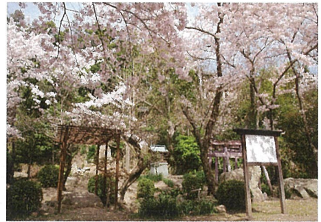
伝大石良雄仮寓地跡(おせど)