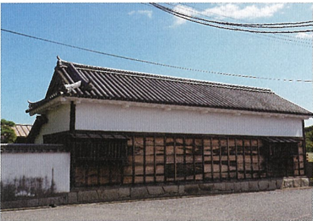
近藤源八宅跡長屋門