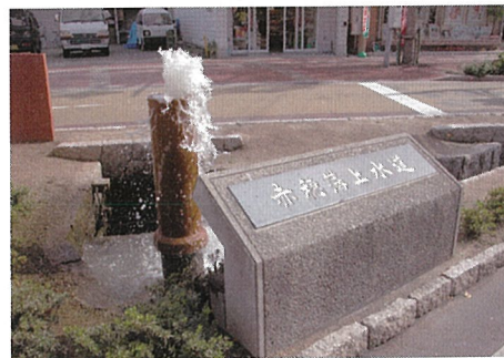
旧赤穂上水道モニュメント