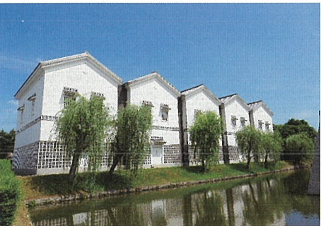
赤穂市立歴史博物館

の後、平成 10 (1998) 年に二之丸整備事業に伴い二之丸門跡付近に移設され現在に至っている。