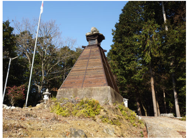
東有年地区 「舟灯台」