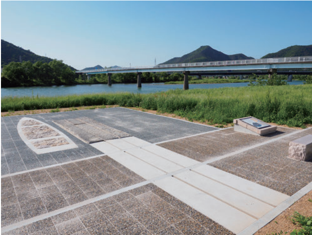
坂越地区上高谷 高瀬舟舟着場跡モニュメント

千種川沿いの村々には多くの船着場が造られたほか、東有年には高瀬舟のための灯台「舟灯台」が設置されている。坂越地区上高谷 かみたかや に存在した高瀬舟舟着場跡がモニュメントとして整備されているほか、東有年の舟灯台は現在でも見学することができる。