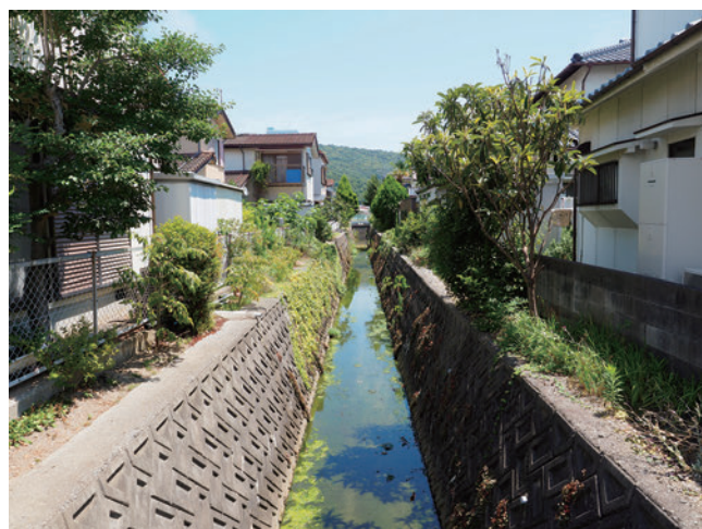
住宅街に残る塩田の水尾跡