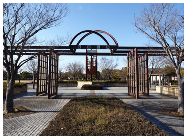
古浜町(塩屋公園付近)