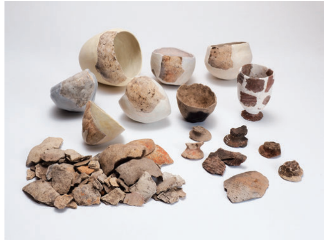
堂山遺跡から出土した製塩土器