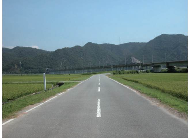
線路跡（高雄地区周世付近）