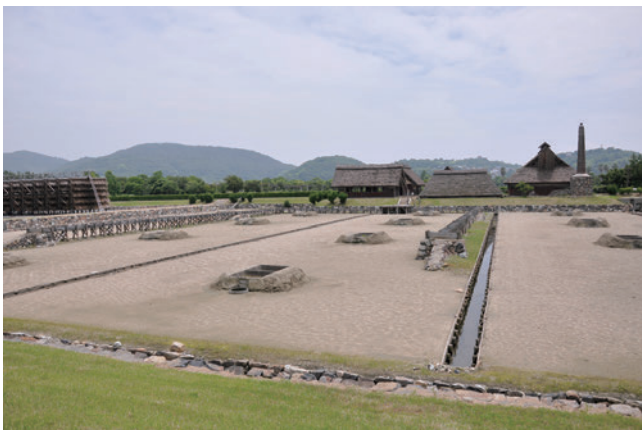
復元された入浜塩田

そのため、江戸時代からそのまま伝統的な製塩を行う塩田は残されていないものの、兵庫県立赤穂海浜公園内にある「塩の国」では、各時代の塩田が復元され、現在でも伝統的な方法を用いた塩づくりを見学することができるとともに、塩づくり体験などを行うことができる。また、隣接する赤穂市立海洋科学館では、塩づくりの仕組みや歴史を知ることができる。