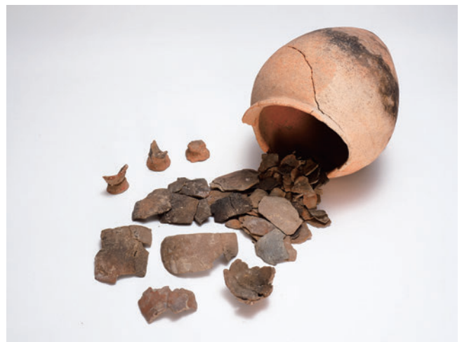
東有年・沖田遺跡から出土した製塩土器(左手前)と製塩土器が入られていた甕形土器(右奥)。