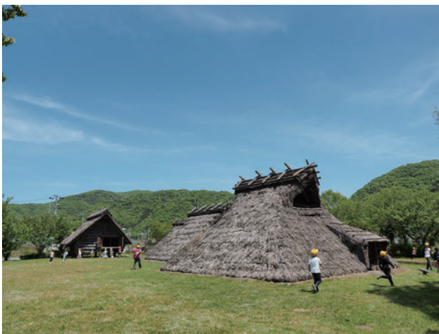
東有年・沖田遺跡公園

製塩土器は赤穂で作られたものではなく、讃岐(香川県)で作られたものである可能性が高い。製塩土器が遠く離れた場所へ持ち込まれることは珍しく、当時の塩の流通範囲や交流などを考えるうえで貴重なものである。現在、遺跡は歴史公園として整備されており、復元された建物を見学することができる。