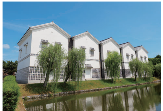
赤穂市立歴史博物館