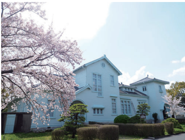
旧日本専売公社赤穂支局 （現 赤穂市立民俗資料館）

明治41（1908）年に建築された当時の建物は、日本で唯一現存する塩務局庁舎であり、その重要性から昭和61（1986）年に県指定文化財となった。現在は赤穂市立民俗資料館として公開されており見学できるほか、かつて専売公社が所有していた塩倉庫群についてもその一部が現存している。かつて塩の積み下ろしや運搬が行われた赤穂港や新川、現在も営業する製塩会社などとあわせ、塩のまち赤穂の景観をみることができる。