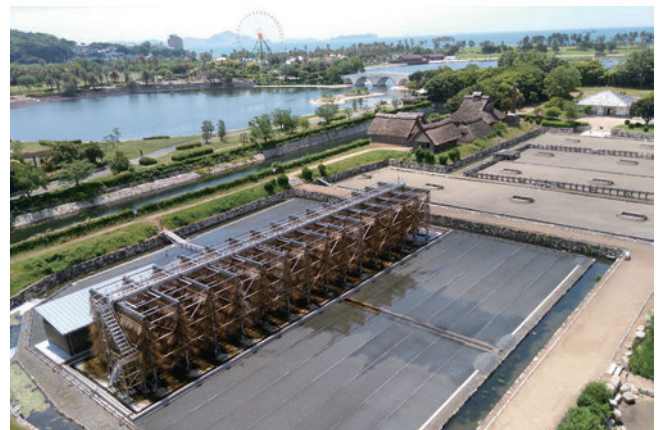
復元された流下式塩田