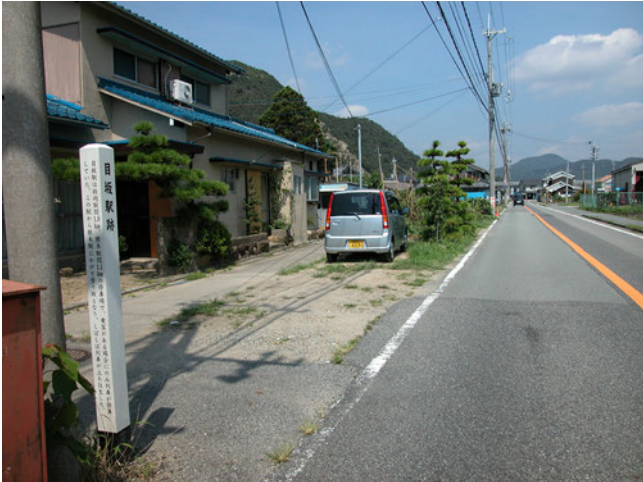
赤穂鉄道 旧目坂駅付近