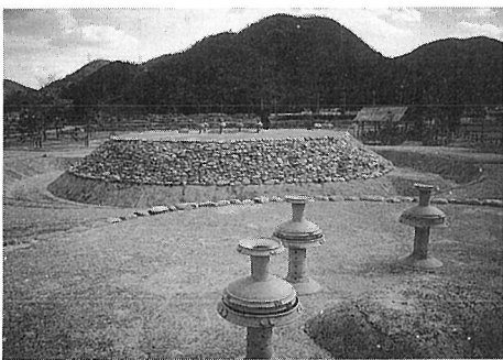
有年原・田中遺跡公園

原小学校校地及びその南に広がる田圃の微高地上に立地する弥生時代中期(約2,100年前)～室町時代(約600年前)まで続く大規模な遺跡である。原小学校校舎新築工事に伴う発掘調査では、飛鳥・奈良時代の掘立柱建物跡群が検出され、円面硯 えんめんけん ・墨書土器 ぼくしょ ・フイゴ羽口などが出土していることから、これらの建物群が古代の役所的な施設であったと考えられている。また、ほ場整備事業に伴う発掘調査によって、弥生時代後期の大型墳丘墓 ふんきゅうぼ が2基発見され、全国的に話題を呼んだ。特に1号墳丘墓は、幅5mの溝によって囲まれた直径18mの円形の墳丘墓で、東にはバチ状に開く陸橋部、西には祭壇となる突出部を備えた全国でも稀な形をしたものである。墳丘墓の周溝から出土した大型の壺 か 、器台 たかつき 、高杯 そうそう は葬送儀礼 ぎらい に使用された供