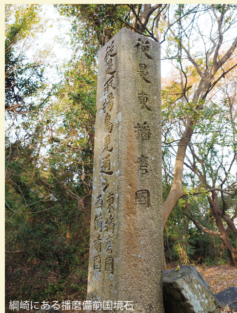
網崎にある播磨備前国境石