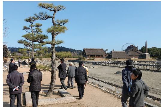
赤穂市歴史文化基本構想策定委員会 (上段：会議 下段：現地視察)