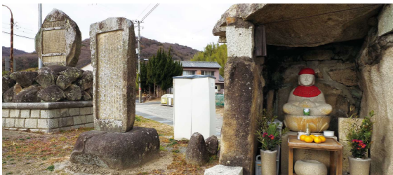
顛和耕地整理記念碑・真木開拓記念碑・延命地蔵