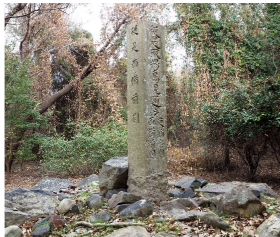
播磨備前国境石(網崎)

また、鳥打峠を境とした交通路は、現在もそのほとんどが道路として残されており、街道沿いに建てられた寺院や神社、地蔵などが多く残されています。