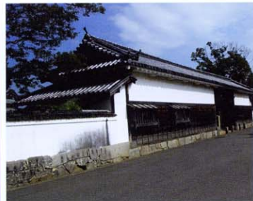
史跡大石良雄宅跡の長屋門