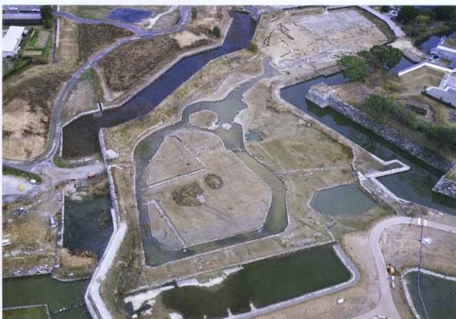
大小二つの中島を備えた雄大な池泉下流部（発掘状況）