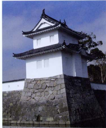
大手隅櫓(昭和30年再建)