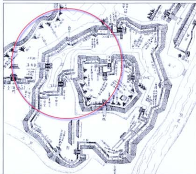
絵図に描かれた二之丸庭園の池泉

上：『赤穂城内侍屋敷間数図』部分 （『赤穂市史第五巻 付図3』から一部転載、 原図は花岳寺蔵）