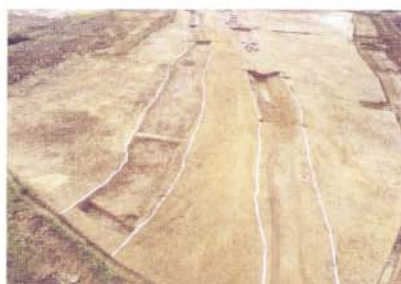
弥生時代の終わり頃には、2条の大溝が掘削されます

Two large ditches dug in the late Yayoi Period