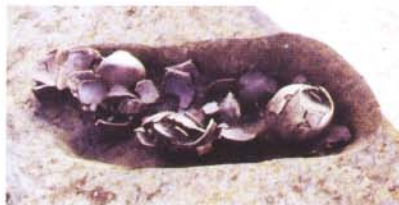
土器が出土した様子