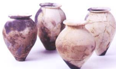
出土した弥生土器