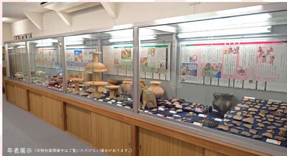
年表展示 (※特別展開催中はご覧いただけません場合があります。)