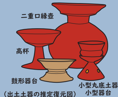
出土土器の推定復元図

後円部の頂上では、古墳に供えられた土器が多く出土しました。土器は奈良県や大阪府で見られるものと全く同じ形・作り方であったことから、古墳に葬られた人物が、ヤマト政権と密接なつながりを持っていたことがうかがえます。