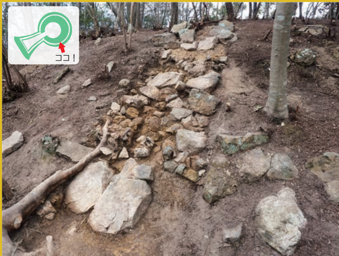
後円部上段の発掘調査

有年地区には約300もの古墳が集中していますが、そのうち前方後円墳は放亀山古墳のみです。また、その年代も古墳時代前期前半と古いもので、有年地区で最初に造られた本格的な古墳といえます。