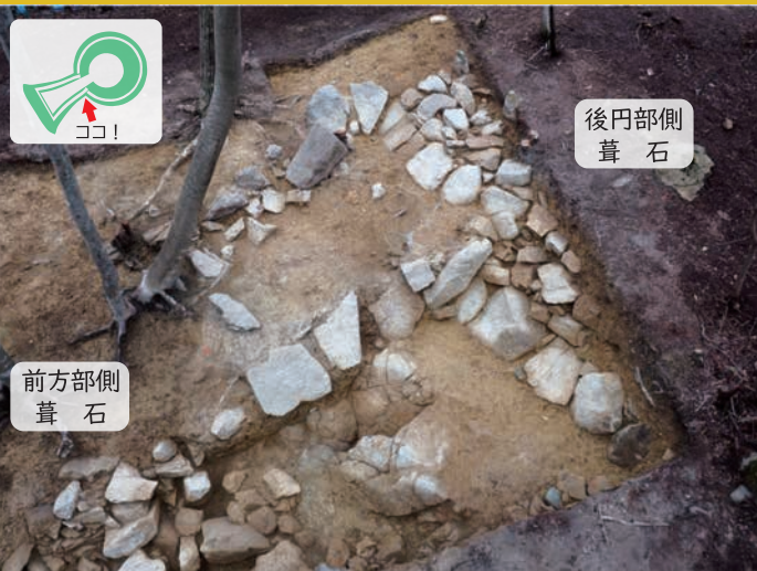
くびれ部の発掘調査